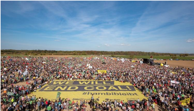
Abbildung 1: Großdemonstration am Hambacher Wald am 6.10.2018

Vor diesem Hintergrund war es besonders interessant in der Dissertation zu untersuchen, wie diese beiden Aspekte zusammenspielen: Inwieweit können diejenigen, die den Ausstieg vorangebracht haben, sich auch aktiv an der Gestaltung der Transformation beteiligen? Daraus leitete sich das übergeordnete Forschungsziel ab, die Möglichkeiten und Grenzen zivilgesellschaftlicher Beteiligung im Transformationsprozess der Braunkohlereviere aufzuzeigen.